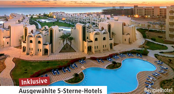
Inklusive Ausgewählte 5-Sterne-Hotels