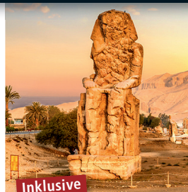
Inklusive Memnon-Kolosse (Welterbe)