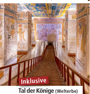
Inklusive Tal der Könige (Welterbe)