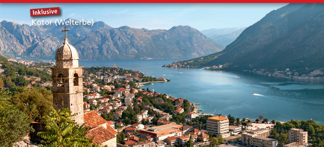
Inklusive Kotor (Welterbe)