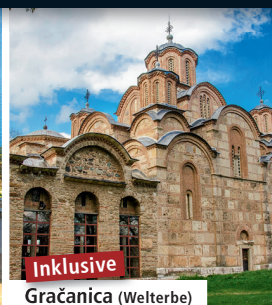
Inklusive Gračnica (Welterbe)