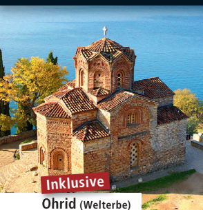
Inklusive Ohrid (Welterbe)

Eine der beliebtesten Studienreisen der Deutschen - mit Europas schönster Küste und 4 Welterbestätten!