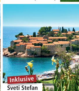
Inklusive Sveti Stefan